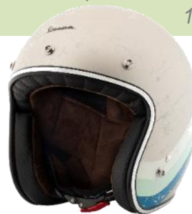
Biancospino Vespa 125 Primavera 1967