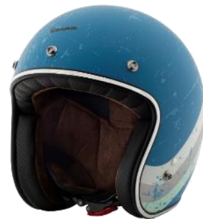
Azzurro Cina Vespa 50 Special 1969